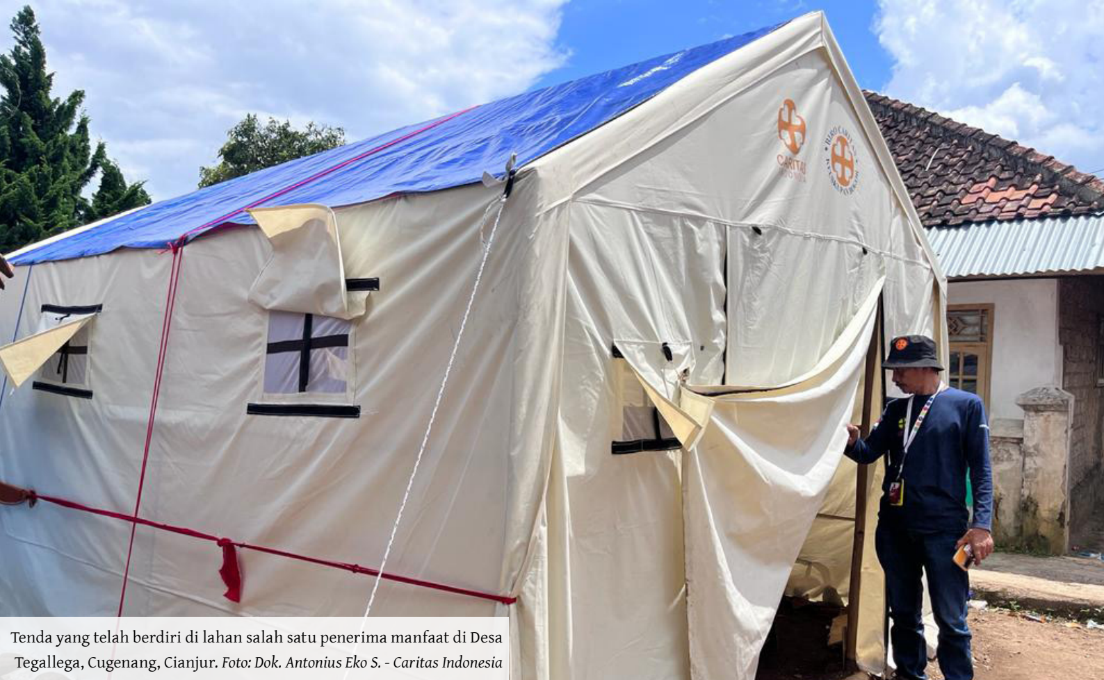
Tenda yang telah berdiri di lahan salah satu penerima manfaat di Desa Tegallega, Cugenang, Cianjur.

gal di tenda darurat. Ya mau bagaimana lagi, diterima aja apa adanya,” ujar Ela.