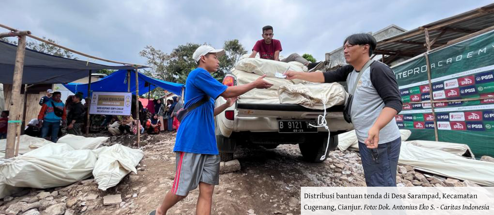
Distribusi bantuan tenda di Desa Sarampad, Kecamatan Cugenang, Cianjur.