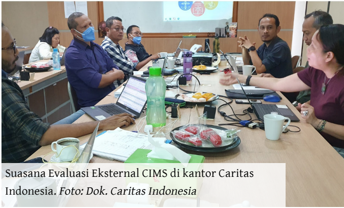
Suasana Evaluasi Eksternal CIMS di kantor Caritas Indonesia.

ruh dunia diselenggarakan untuk koordinator CI MS nasional (6 pelatihan dengan total sekitar 170 peserta) dan penilai CI MS (6 pelatihan dengan sekitar 110 peserta). Komite Peninjau dibentuk sebagai badan pengatur tambahan dengan mandat untuk mengawasi pelaksanaan CI MS.