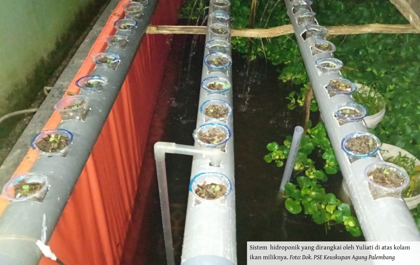
Sistem hidroponik yang dirangkai oleh Yuliati di atas kolam ikan miliknya.