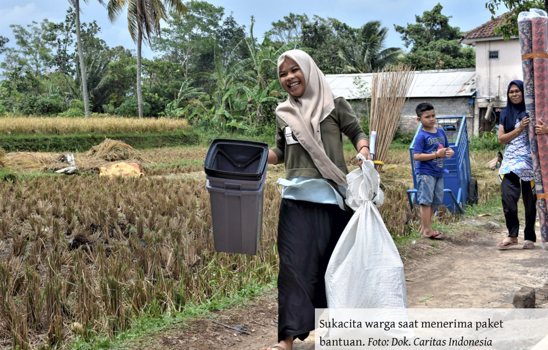
Sukacita warga saat menerima paket bantuan.

sehingga dapat hidup semakin baik. Hal ini demi pelayanan terbaik bagi penyintas bencana.